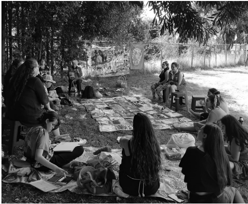
Imagen 2: La «Colcha del agua».

La información incorporada en «AGU(J)A» fue elaborada de manera conjunta con las textileras, lo que le da un carácter colaborativo y situado al permitir que cada grupo definiera los contenidos considerados pertinentes. Además de compartir la información con las textileras, el mapeo ha sido presentado en diversas instancias académicas y de defensa del agua en Chile, México y España, con el objetivo de difundir y visibilizar estas redes de resistencia y de nutrir conexiones con otras luchas afines en distintos territorios.