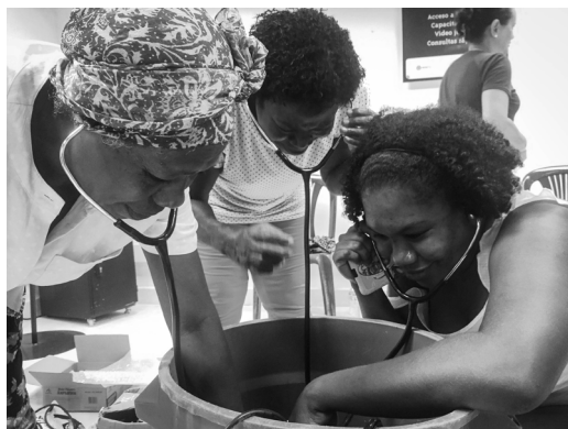
Imagen 1: Laboratorio de exploración de la escucha subacuática. Autor: Leonel Vásquez, 2019.

Los participantes del taller se entregaron al ritual sonoro de la vida, participando de baños sonoros subacuáticos. Se sumergieron en los cantos de las ballenas, flotando y escuchando mientras las lanchas pasaban cerca. En ese vaivén del mar, prestaban atención a lo que sonaba alrededor. Estos sonidos ayudaron a conectar la noción del cuerpo humano como un cuerpo de agua, un fluido entre el mundo interior y el exterior.