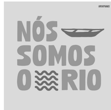
Imagen 2: El Movimiento Arapiuns Río de Derechos.

COP del PAE Lago Grande fue pensada como un evento preparatorio de las organizaciones del Bajo Amazonas con miras a sus movilizaciones hacia la COP de Belém. Entre sus objetivos, buscaba proporcionar a la población local información sobre las negociaciones climáticas globales y construir puentes con la realidad vivida por las familias del territorio.