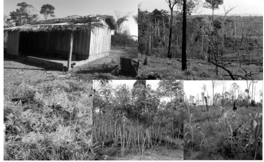
Imagen 2: Interior de la RLB, ocupada por las familias de «sin tierra», en mosaico. A) Vivienda de familia de «sin tierra». B) Zona de pastos. C) Cultivo de frijol. D) Cultivo de mandioca; E) Cultivo de maíz.

Hoy en día, con aproximadamente 280 familias reapropiándose socialmente del territorio que había sido invadido por las agromilicias, las familias campesinas están produciendo una variedad de alimentos ligados a la producción agroecológica (leche, banana, frijol, maíz, café, cacao, mandioca, etc.) (imagen 2).