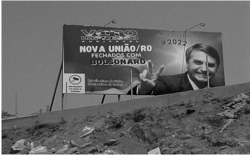
Imagen 1. Cartel publicitario bolsonarista en el municipio de Nova União, situado en el interior de Rondônia, en la Amazonía occidental.

El bolsonarismo es un modelo contemporáneo de fascismo (y debe de ser combatido como tal) porque está subordinado, voluntariamente, al imperialismo ecológico global y tiene una técnica racional y oportunista que moviliza irracionalidades; de tal manera, hace culto y naturaliza la muerte, el racismo, la homofobia y la misoginia, a la vez que enaltece una pureza moral (y falsa) y sale en búsqueda de un enemigo común.