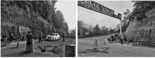
Imagen 1 y 2. Filtro sanitario en la comunidad de San Nicolás. Autor: Jimmi Calixto Cajero (10 de abril de 2020).

Después, como la comunidad desconocía en qué consistía la pandemia y las medidas sanitarias recomendadas, porque no había información escrita en su lengua, realizaron talleres con el médico local no indígena, que les explicó a todos el uso correcto del cubrebocas, cómo lavarse las manos, cuáles eran los principales síntomas del COVID-19 y qué hacer en caso de infectarse. Mientras el médico explicaba, un integrante de la comunidad traducía de forma simultánea al otomí. Además de informar oralmente a la comunidad, se generaron algunos documentos en castellano y se compartieron a través de Facebook y WhatsApp, para dar a conocer lo que se estaba haciendo en San Nicolás.