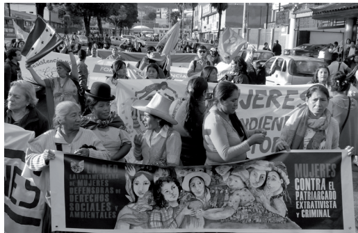
Imagen 2. Red de Sanadoras Ancestrales Iximulew-Guatemala.