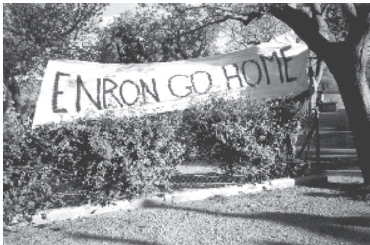
Lucha en la Ribera d'Ebre (Foto de R. Ginalt, Miravet, marzo 2001).

Resistencia Anticapitalista. Jornadas «Barcelona Tremola» mayo-junio 2001