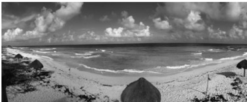
Imagen 1. Recursos naturales de uso turístico. (Autor: Alejandro Palafox Muñoz)

(BM) y el Banco Interamericano de Desarrollo (BID). Con estos recursos se crea Cancún, que actualmente se posiciona como uno de los destinos turísticos de mayor importancia en el mundo. En consecuencia, el estado de Quintana Roo adquiere centralidad en la política turística nacional teniendo como resultado su expansión hacia el sur de la entidad, con los proyectos de Riviera Maya y Costa Maya; además, existen otros espacios, como Cozumel, Puerto Morelos, Holbox e Isla Mujeres, que han desarrollado la actividad turística sin el desmedido apoyo financiero que tienen los destinos cobijados por el Estado. Posterior al desarrollo de Cancún, la actividad turística experimentó una expansión impetuosa en la región desde inicios del siglo XXI, sobre todo en la costa oriental del estado de Quintana Roo, que influyó en otros destinos tales como Isla Mujeres, Playa del Carmen y Tulum, que incrementaron sus flujos de visitantes en un 4,9% en promedio; así, en el año 2015 ingresaron al estado 14,9 millones de turistas internacionales, es decir, el 46,6% del total nacional (SEDETUR, 2015).