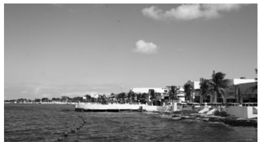
Imagen 3. Malecón Costero Norte, 2013.