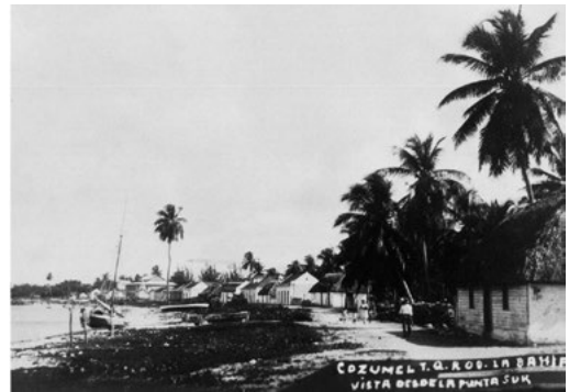
Imagen 2. Mercantilización de la naturaleza.

y servicios ambientales con la finalidad de insertarla en los procesos productivos propios del mercado, tales como la creación de los bonos de carbono. Killeen (2007) plasma esta idea con lo que sucede en la Amazonia, donde se crearon áreas naturales protegidas complementadas con reservas indígenas enfocadas a la captación de ingresos económicos a partir del pago de servicios ambientales para subvencionar el crecimiento económico de la región. Así, la naturaleza se anexa a la suma de bienes y servicios al interior de los sistemas económicos (Smith, 1990), toda vez que los recursos se encontraban fuera del mercado y el modo de producción se apropia de ellos, lo que Harvey (2004) denomina acumulación por desposesión.