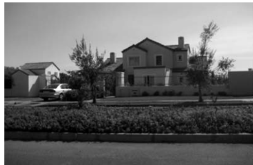
Proyecto Piedra Roja en la comuna de Colina – laguna artificial y uso extenso de pasto, dos nuevos usos intensivos de agua en la zona de Chacabuco (Autor: Michael Lukas)