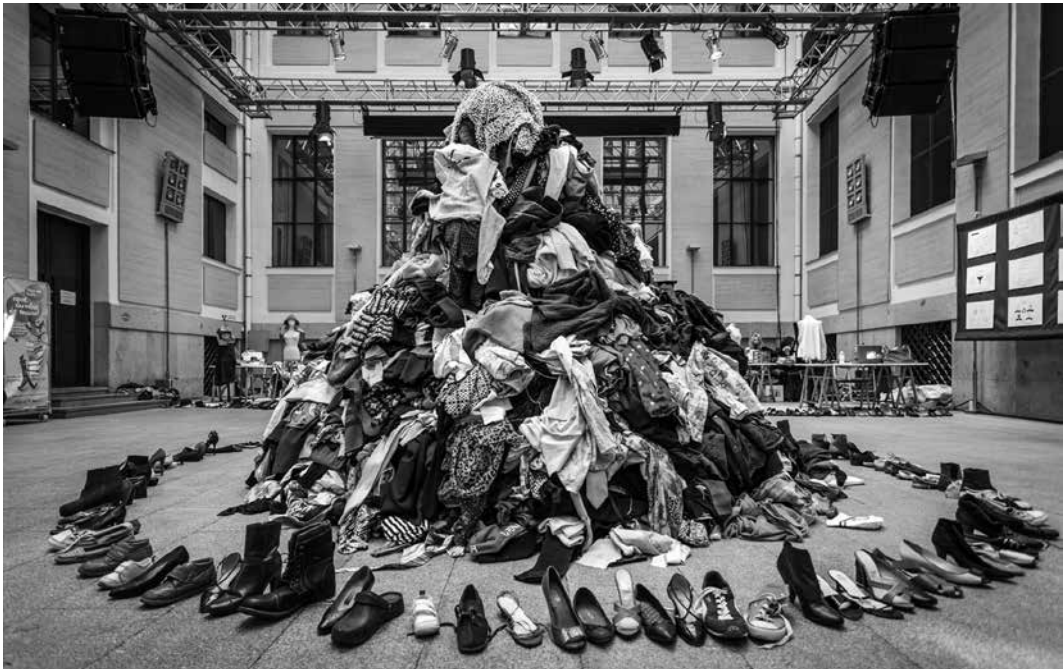
Imagen 1. Maratón de reciclaje. Evento organizado por AltrapoLab, espacio de cocreación, participación y difusión de la práctica del upcycling y de la problemática textil. Autora: Julieta Pellicer (2018).

for Circular Design, 3 de la University of the Arts London, y conducido por la profesora Rebecca Earley, es un ejemplo del uso del upcycling como metodología de estudio: durante cuatro años se investigó la creación, a partir del upcycling , de una materialidad contemporánea que comprende fibras, modelos y estilos de vida. Sobre la base de la cooperación entre disciplinas y la diversidad territorial conectada en red, se propuso estudiar esta materialidad cíclica, contemporánea y de calidad. Una materialidad segura para la vida y el planeta, confeccionada de fibras textiles que pueden permanecer circulando para su continuo uso sin perder valor ni propiedades.