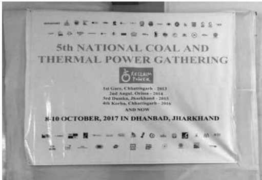
Imagen 3. Pancarta de la quinta reunión nacional de minería de carbón y centrales termoeléctricas.

ingenieros, abogados, pescadores costeros y de arrastre, abuelas, estudiantes, sacerdotes católicos, políticos de distintos partidos (Congreso, Aam Aadmi, partidos locales de Goa y hasta un ministro del Bharatiya Janata Party, ahora en el poder)... todos ellos en contra del proyecto de expansión. El Gobierno de la India tiene ahí un hueso duro de roer.