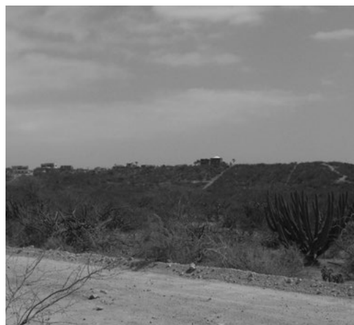
Imagen 2. Vista de la fragmentación del paisaje en el área de estudio.

El creciente valor de la tierra impulsa a los pequeños propietarios a vender sin tomar en cuenta que el desierto limita las actividades que pueden desarrollar sin tierra. Muchos de los que vendieron sus tierras no tuvieron otra opción que volverse empleados domésticos, muchas de las veces sin contrato y fuera del amparo de la Ley laboral, quedando cautivos en un sistema que les confina a una vida con poca seguridad y poca movilidad socioeconómica.