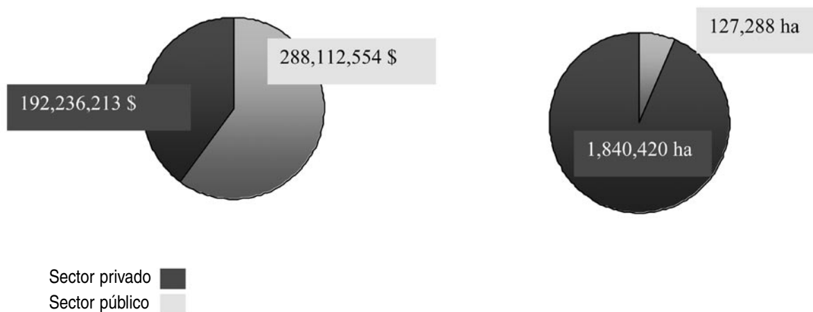
Distribución de las inversiones privadas y públicas

En los últimos años un número muy alto de campesinos subsaharianos ha sido expulsado de sus tierras. En