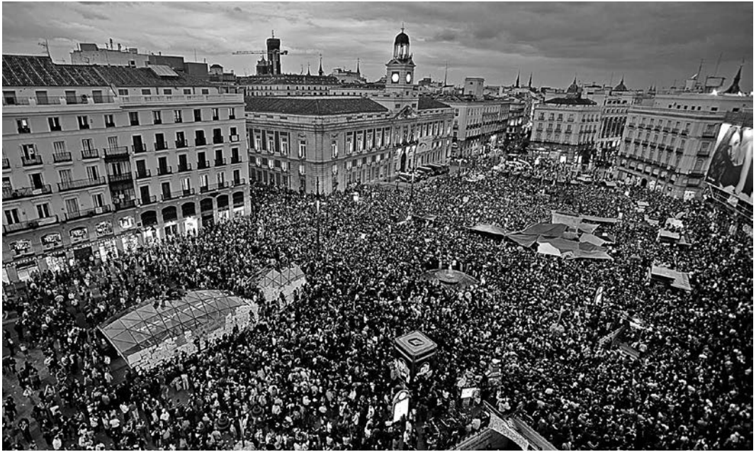
15-M en la Plaza del Sol, Madrid

estallido de la crisis, el profundo impacto social provocado por las políticas anticrisis y la explosión del 15M. Bajo la retórica de la crisis se está llevando a cabo una profundización del programa neoliberal y ante la crisis del capital financiero y las políticas neoliberales, en lugar de abandonar esa senda, se han aumentado las dosis de veneno neoliberal sobre el cuerpo social (López y Rodríguez, 2010; Observatorio Metropolitano, 2011; Observatorio Metropolitano, 2012).