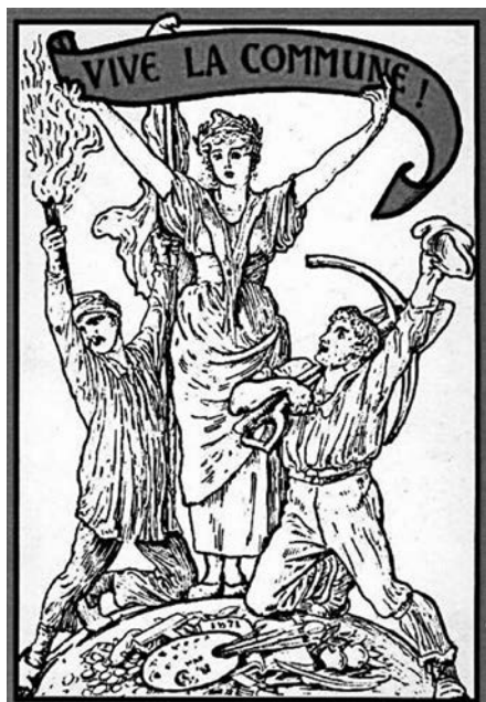
Cartel de la Comuna de París, 1871.

Un aspecto destacable de este panfleto es que circunscribe la noción de los comunes dentro del contexto de las luchas y conflictos sociales, rompiendo con ese componente tan bien instalado dentro del cuerpo social, como es la naturalización de la noción de propiedad. Por lo que, todos los bienes son susceptibles de ser comunes y gestionados colectivamente. Así pues, se hace un boquete en la línea de flotación de la sociedad capitalista al disparar a la sacralizada propiedad privada. No solamente se plantea la resistencia social ante el ataque contra los bienes de titularidad pública, con la excusa de la crisis, sino que abre el debate sobre la okupación de nuevos espacios para su gestión colectiva y la alteración de la propiedad. Además, se rompe con planteamientos binarios capital/estado y público/privado, para abordar el procomún, entendido como algo más complejo y fundamental para la reproducción social, que ni el estado ni el mercado capitalista son capaces de asegurar. La virtud de este trabajo es que recupera nociones que hasta ahora estaban escondidas bajo llave: revolución y comunismo. ■