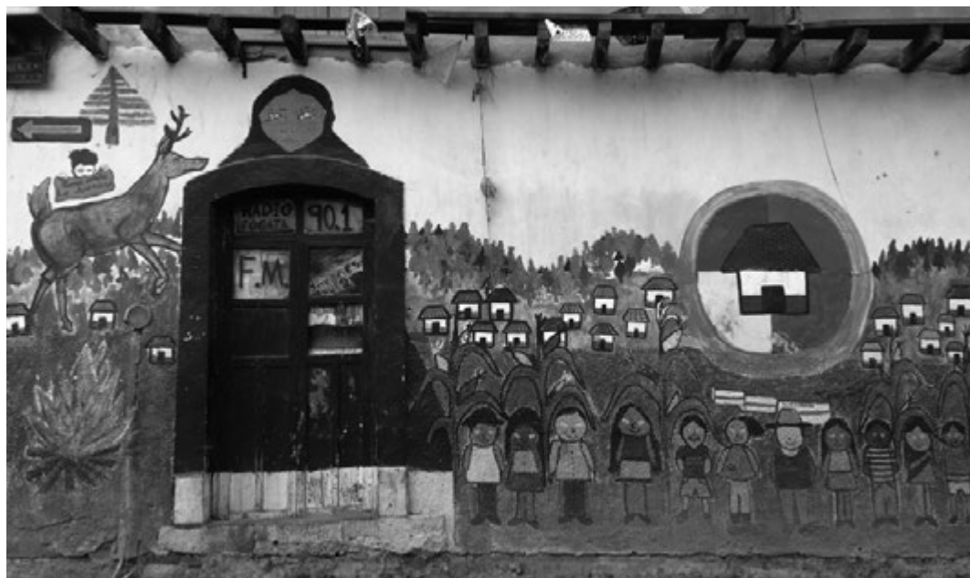
Imagen 1. Pintura mural en Cherán. Autor: Oscar Salmerón.

(2815 hectáreas) y se concentró en la zona más cercana al núcleo urbano (España-Boquera y Champo-Jimenez, 2016: 146).