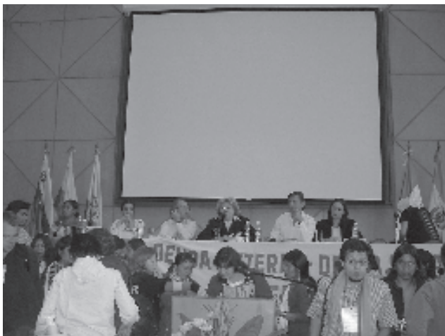
Miembros del tribunal.