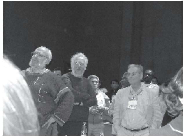
Escuchando el veredicto.

El veredicto recibió el aplauso emocionado de toda la concurrencia. Había un sentimiento general de que se empezaba a hacer justicia.