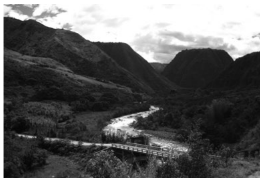
Imagen 1 Vista del río Íntag. (Autora: Mariana Walter)

2010). En el caso del proyecto no extractivo, se han utilizado de forma comparativa los estudios realizados sobre una zona de características comparables a Íntag: Mindo, que ha desarrollado desde los años 1970 un perfil turístico (para más información: Larrea et al. , 2015; Walter et al. , 2016).