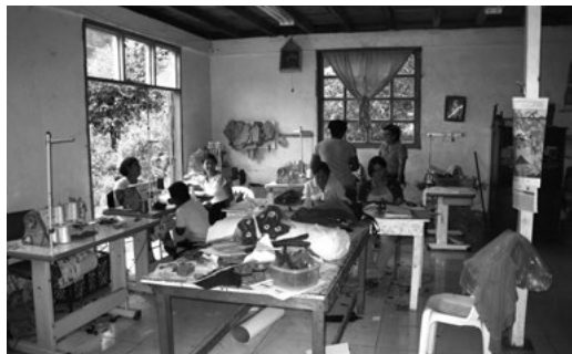
Imagen 2. Taller de manualidades de mujeres de Manduriacos.

el rol (de sinergia y competencia) que podrían tener los centros urbanos de Cotacachi y Otavalo como proveedores de bienes y servicios.